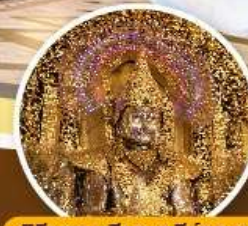
พิธีกรรมเศียร เจดีย์ทาบาว