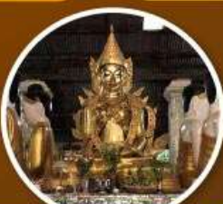
พระพุทธรูปม่านอ่อนหมื่นสะจำขึ้น