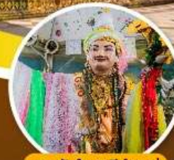
เทพทันใจ เจดีย์ซุหลอ