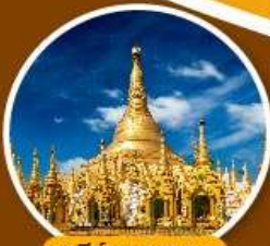
เจดีย์ชเวดากอง