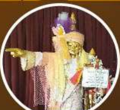
เทพทันใจ ใจเจ้า