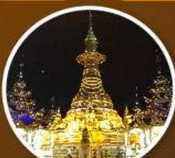
เจดีย์องค์ดอกหญ้า