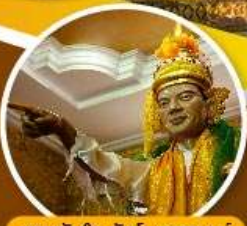
เทพทันใจ วัดโตนดากาวน